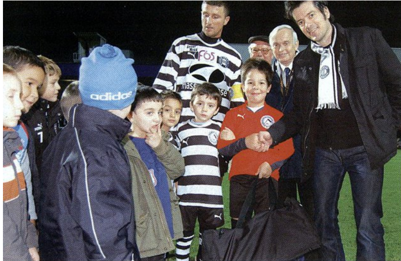
Ein Handshake auf eine erfolgreiche Zukunft: Die Unter 7-Nachwuchsmannschaft des Wiener Sportklub wird von der Anhängervereinigung des Wiener Sport Club unterstützt.